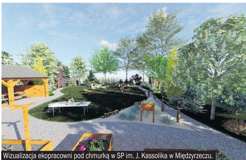
Wizualizacja ekopracowni pod chmurką w SP im. J. Kassolika w Międzyrzeczu.