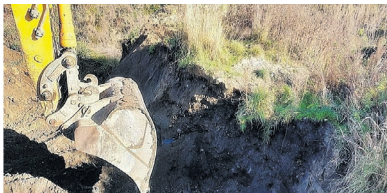
Koparka odkopuje chemikalia.

Częstochowska policja odnalazła w Bieruniu nielegalne składowisko substancji niebezpiecznych dla zdrowia i życia ludzi. To element szerszego śledztwa obejmującego województwa śląskie i opolskie.