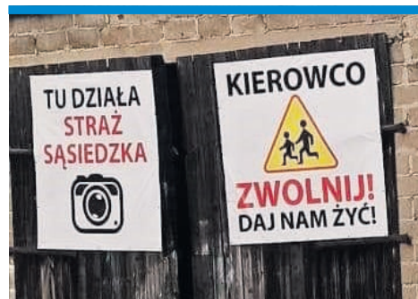
DROGA PRZEZ MĘKĘ