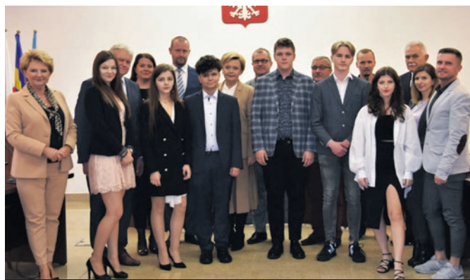
Stypendyści w towarzystwie przedstawicieli władz naszego powiatu.

► Uczniowie naszych powiatowych szkół znaleźli się w gronie stypendystów Prezesa Rady Ministrów na rok szkolny 2022/2023.