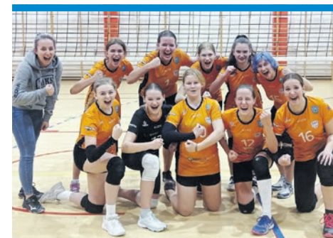
IMIELIŃSKI POCIĄG DO PIERWSZEJ LIGI SIĘ NIE ZATRZYMUJE