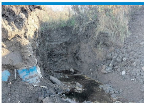
ŚMIECIOWA MAFIA ZAWITAŁA DO NASZEGO POWIATU