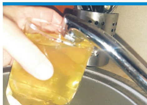
KIEDY W KRANACH POPŁYNIE NORMALNA WODA?