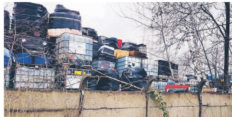
W Mysłowicach likwidacja składowiska niebezpiecznych substancji kosztowała 100 milionów złotych!

Policjanci z częstochowskiej spec-grupy w ścisłej współpracy z katowicką prokuraturą zatrzymali do tej pory 58 osób za udział w zorganizowanej grupie przestępczej, czerpiącej zyski z transportowania i składowania groźnych dla życia i zdrowia substancji. To ogromny sukces, ale pamiętajmy, że jest to zapewne wierzchołek góry lodowej. Czujność powinni zachować też samorządowcy, aby nie skończyło się, jak w Mysłowicach.