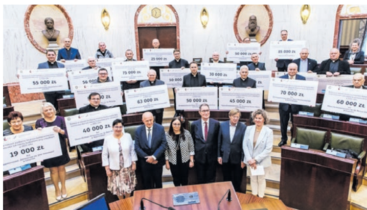
Przedstawiciele nagrodzonych parafii w sali sesyjnej Sejmiku Śląskiego.

Dotacje na prace konserwatorskie otrzymali, m.in. Parafia Rzymskokatolicka św. Bartłomieja Apostoła w Bieruniu (70 tys. zł) i Parafia Ewangelicko-Augsburska w Hołdunowie (41 tys. zł).