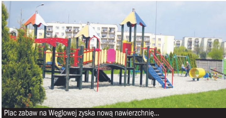
Plac zabaw na Węglowej zyska nową nawierzchnię...