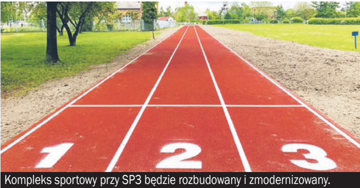
Kompleks sportowy przy SP3 będzie rozbudowany i zmodernizowany.

► Ponad połowa wszystkich gmin w Polsce skorzysta z trzeciej edycji Rządowego Programu Inwestycji Strategicznych, skierowanej tym razem do miejscowości, gdzie funkcjonowały kiedyś Państwowe Gospodarstwa Rolne. W tym gronie jest tylko jeden reprezentant naszego powiatu.