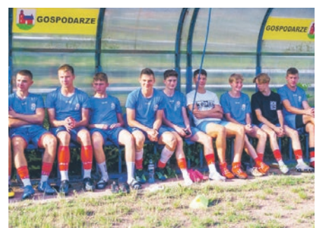
Na stronie Śląskiego Związku Piłki Nożnej ukazał się artykuł o najlepszym klubie piłkarskim naszego powiatu.