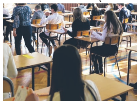
Opublikowano wyniki egzaminów ósmoklasistów.

Wyjątkowo dobrze wypadli uczniowie z Imielina.