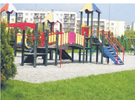
Z naszego powiatu tylko Bieruń dostał pieniądze z trzeciej edycji Polskiego Ładu.