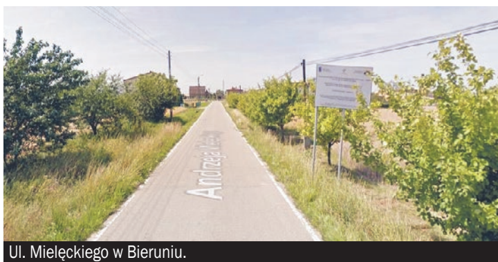
Ul. Mieleckiego w Bieruniu.