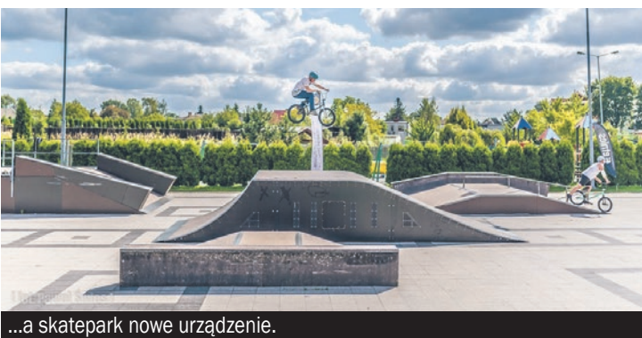
...a skatepark nowe urządzenie.