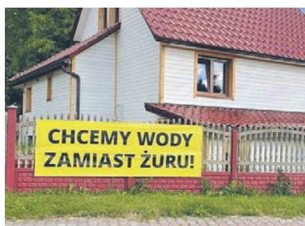
Ciąg dalszy łędzińskiej hydrozagadki.