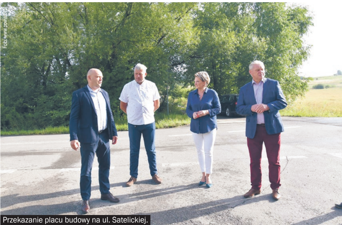
Przekazanie placu budowy na ul. Satelickiej.

Zestaw inwestycji realizowanych przez powiat bieruńsko-łędziński uzupełnia remont ul. Zamoście, który już niebawem zostanie zakończony. Warto dodać, że pieniądze dołożyły do tego Lasy Państwowe.