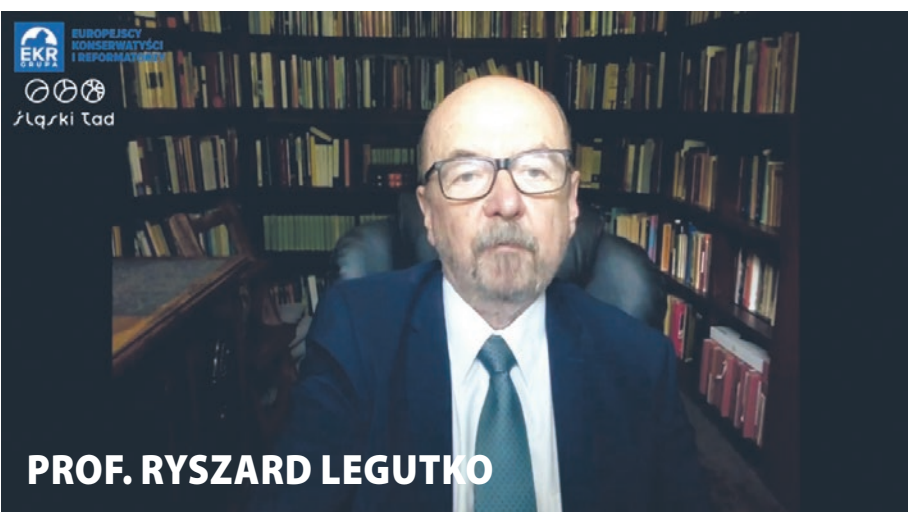
PROF. RYSZARD LEGUTKO

Jesteśmy na progu ogromnej transformacji i wspólna wizja przyszłości napawa optymizmem, ale to nie znaczy, że powinniśmy być zadowoleni. Ryzyko zawsze istnieje. Przekształcenie obecnego systemu oznacza radzenie sobie ze starymi zagrożeniami i napotykanie po drodze nowych. Regiony o kręgosłupie przemysłowym, takie jak Śląsk, są dobrze przygotowane do wykorzystania swojej wiedzy, gospodarki i potencjału, aby przejść z tradycyjnej energii na czystą.