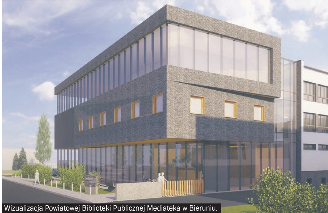
Wizualizacja Powiatowej Biblioteki Publicznej Mediateka w Bieruniu.

Powiat bieruńsko-łędziński także przygotował swoją ofertę. Będziemy się starać o dofinansowanie budowy ciągu pieszo-rowerowego w pasie ulic Jagiellońska-Lipowa w Łędzinach. Przewidywany koszt tej inwestycji wynosi 2,8 mln zł . Zdecydowanie najdroższym projektem w tym pakiecie jest mediateka przy LO w Bieruniu. Powstanie nowoczesny obiekt publiczny z bibliote-