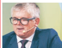
ADAM GAWĘDA, poseł na Sejm RP

Trójmorze jest obecnie najszybciej rozwijającym się regionem na świecie i musimy dobrze wykorzystać ten potencjał. Swoją aktywność inwestycyjną Fundusz koncentruje na trzech obszarach: transport, infrastruktura transportowa i energetyczna.