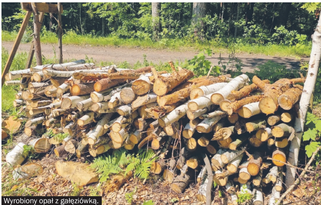
Wyrobyony opał z gałęziówką.

Konsumenci zainteresowani przygotowaniem drewna opałowego powinni zgłosić się do leśniczego, który wyznaczy termin oraz powierzchnię udostępnioną do tzw. samowyrobu. Tam chętni, po przeszkoleniu z zakresu bezpieczeństwa i higieny pracy oraz uzyskaniu pisemnej zgody leśniczego mogą wyrabiać chrust, czyli pozyskiwać drobnicę opałową do średnicy 7 cm w korze w grubszym końcu.