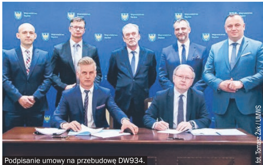
Podpisanie umowy na przebudowę DW934.