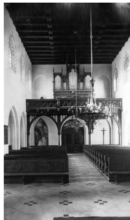
Nieistniejący już ewangelicki kościół Świętej Trójcy w Hołdunowie. Świątynię wybudowano w 1902 r. ale w 1967 r. została rozebrana z powodu szkód górniczych.