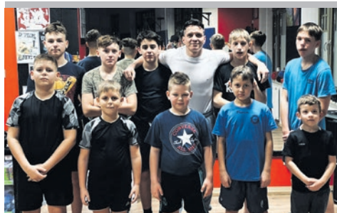
Młodzi garną się do boksu