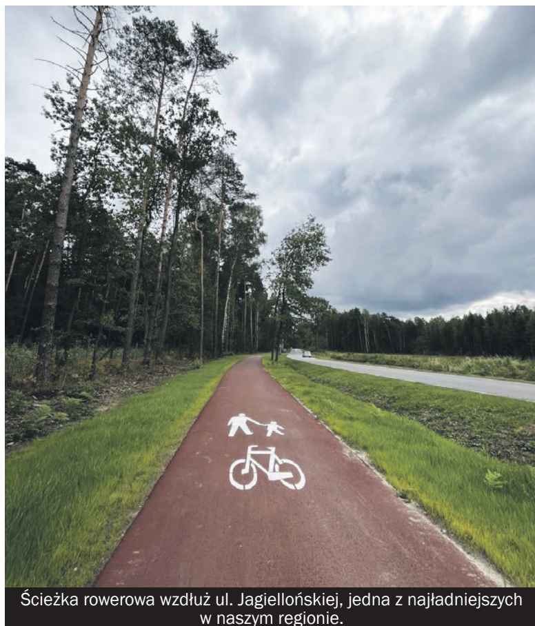
Ścieżka rowerowa wzdłuż ul. Jagiellońskiej, jedna z najładniejszych w naszym regionie.

► W wielu dziedzinach życia miejscowości naszego powiatu wypadają blado na tle innych gmin województwa śląskiego, ale przynajmniej w jednym bijemy innych na głowę.