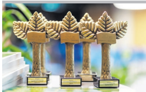
Zielone czeki rozdane!