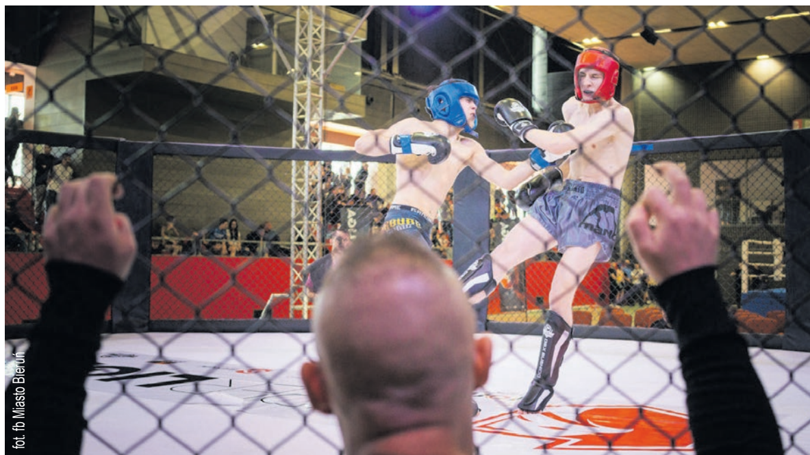
fol. fb Miasto Bieruń

► W Bieruniu odbyły się niedawno Otwarte Mistrzostwa Polski w sportach walki, w formułach: thaiboxing, K1, boxing. To była ważna impreza nie tylko pod względem sportowym, ale także wizerunkowym.