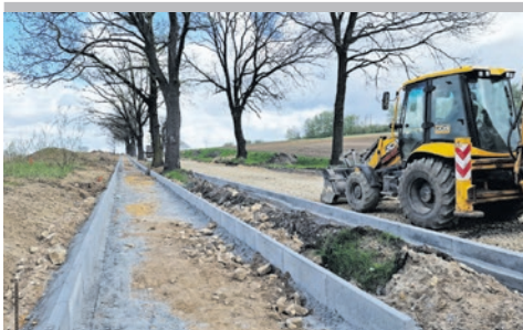
Tychy i nasz powiat - dwa bratanki