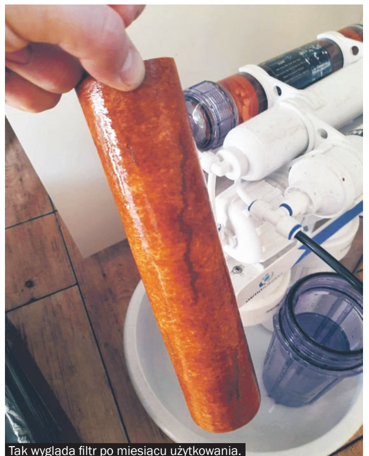
Tak wygląda filtr po miesiącu użytkowania.