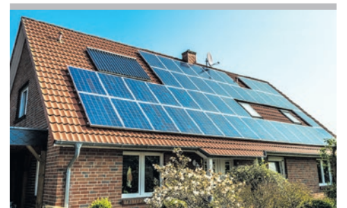
Czas na własny prąd