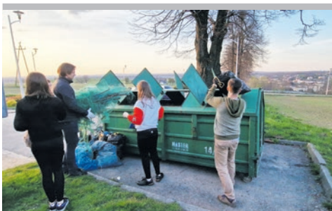
Klimont czysty! Ale na jak długo?