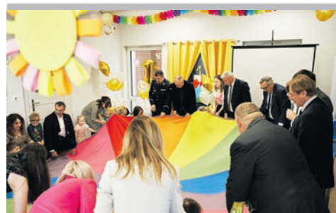
„Roczek” żłobka Mikołajkowo