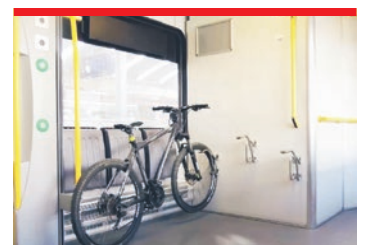
KOŁEM PO ŚLĄSKU