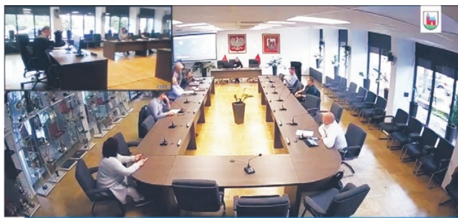
Aktualny temat: Wnioski i zapytania. Rada Miejska Lędziny Komisja w dniu 20 kwietnia 2022 17 00

Kiedyś sesje Rady Miasta nie były transmitowane, a niewielu mieszkańcom chciało się marnować popołudnie, aby na żywo przysłuchiwać się obradom. Dziś mamy internet i transmisje online, które dzięki czułym mikrofonom rejestrują każde słowo rzucone „na boku”. Wystarczy kliknąć, aby przenieść się w fascynujący świat lędzińskiego samo-