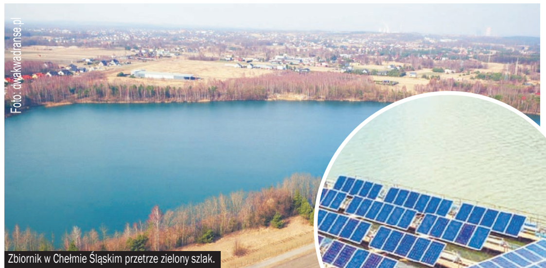
Zbiornik w Chełmie Śląskim przetrze zielony szlak.

Pływająca fotowoltaika jest wydajniejsza, gdyż pozwala wyeliminować