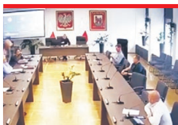
„RANCZO” W ŁĘDZINACH