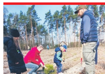
DLACZEGO WARTO SADZIĆ DRZEWA?