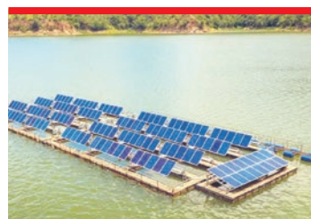
PŁYWAJĄCA FARMA W CHEŁMIE ŚLĄSKIM