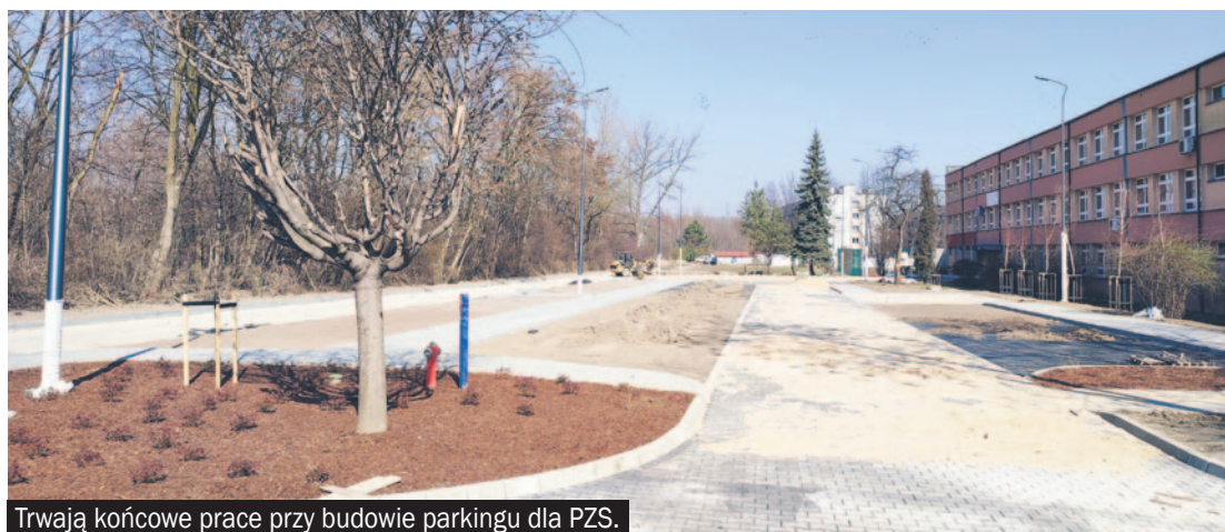
Trwają końcowe prace przy budowie parkingu dla PZS.

rów, będzie również dysponował salami i pracowniami multimedialnymi oraz konferencyjnymi, garderobami, halą z przestrzenią wystawienniczą oraz kawiarnią z zapleczem i tarasem. Oczywiście, to tylko część inwestycji, które zostaną ukończone bądź rozpoczęte w tym roku. Jest też wiele innych, dla których przygotowano dokumentację projektową, ale kwestia realizacji zależy od tego, czego samorządom zawsze brakuje, czyli od pieniędzy. Tak jest, m.in. z planami budowy dwóch rond w Łędzinach, zaplanowanych w miejsce skrzyżowań ul. Fredry i Hołdunowskiej oraz ul. Pokoju i Jagiellońskiej. Póki co, radni powiatu podczas marcowej sesji wprowadzili do budżetu dokumentację projektową.