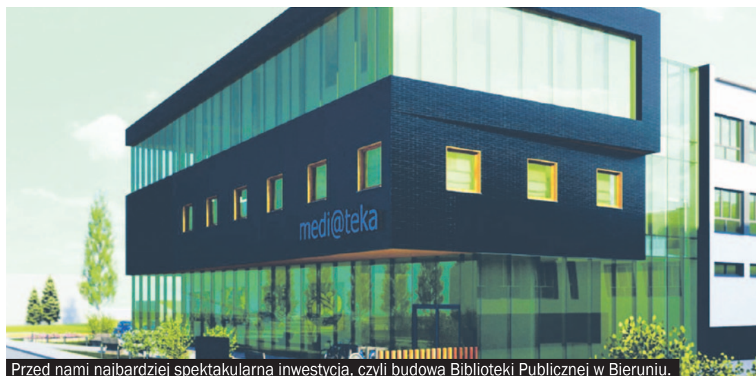
Przed nami najbardziej spektakularna inwestycja, czyli budowa Biblioteki Publicznej w Bieruniu.

Ta inwestycja poprawi bezpieczeństwo uczniów i nauczycieli, a także pozytywnie wpłynie na konkurencyj-