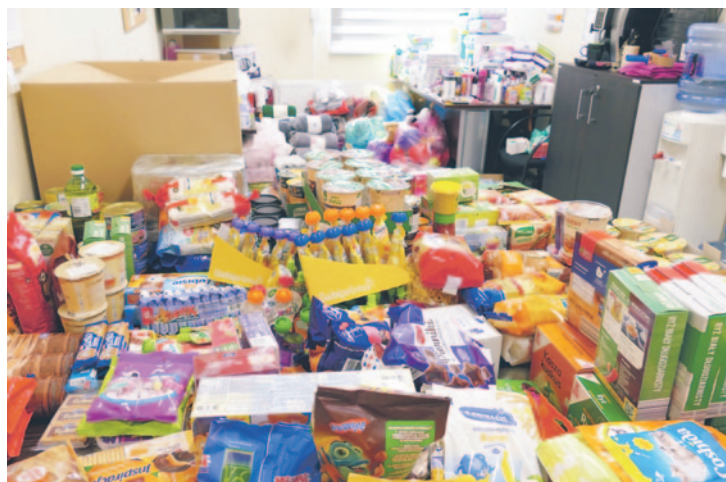
Koleje Śląskie pomagają Ukrainie wspólnie z Caritasem Archidiecezji Katowickiej przekazując najpotrzebniejsze dary w imieniu spółki i pracowników.

Pociągi specjalne i darmowe przejazdy to nie jedyna forma pomocy, w którą włączył się regionalny przewoźnik. Wspólnie z Caritasem Archidiecezji Katowickiej pracownicy Kolei Śląskich zbierają najpotrzebniejsze produkty dla obywateli Ukrainy, a w pociągach i social mediach promowana jest zbiórka pieniędzy.