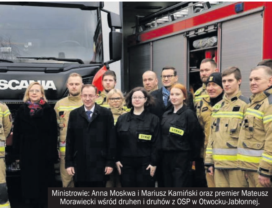
Ministrowie: Anna Moskwa i Mariusz Kamiński oraz premier Mateusz Morawiecki wśród druhen i druhów z OSP w Otwocku-Jabłonnej.