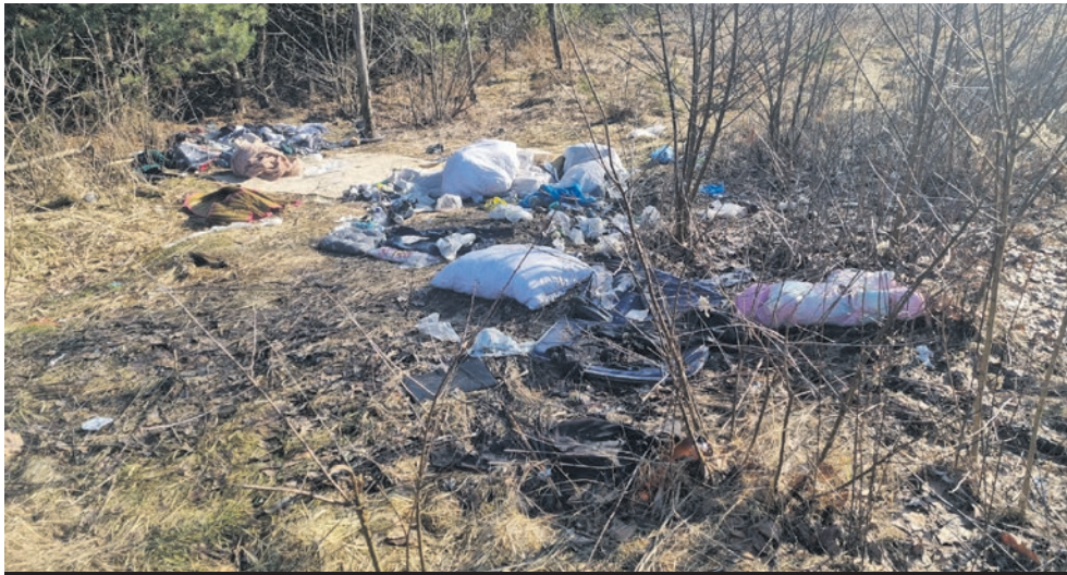
Zaśmiecanie lasów należy do grupy najczęstszych wykroczeń, którymi zajmuje się Straż Leśna.

► Zbliża się 100-lecie powołania do życia Lasów Państwowych. Jedną z ważnych komórek tego przedsiębiorstwa jest Straż Leśna.