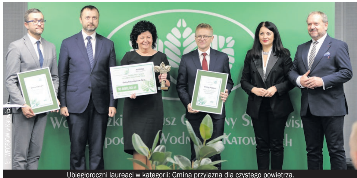
Ubiegłorocznymi laureatami w kategorii: Gmina przyjazna dla czystego powietrza.

▶ Wojewódzki Fundusz Ochrony Środowiska i Gospodarki Wodnej w Katowicach rozpoczyna przyjmowanie zgłoszeń w konkursie „Zielone czeki”, nagród przyznawanych z okazji Dnia Ziemi.