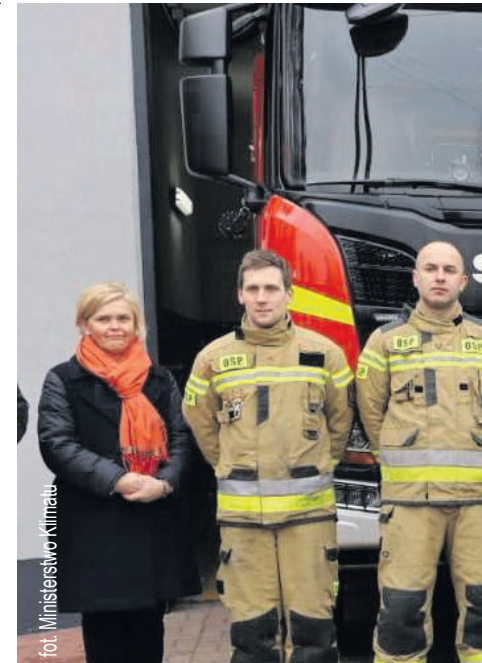
fol. Ministerstwo Klimatu