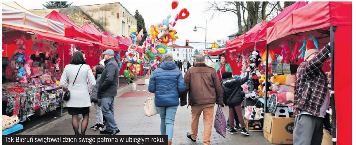
Tak Bieruń świętował dzień swego patrona w ubiegłym roku.

W ten nastrój idealnie wpisuje się hasło promocyjne Bierunia. W lutym „Bierun Ci praje” jest chyba najbardziej popularnym wyznaniem miłosnym w śląskich mediach, ponieważ tutejsze Walentynki cieszą się ogromnym zainteresowaniem regionalnych gazet, portali i rozgłośni. Warto przy tym pamiętać, że jest