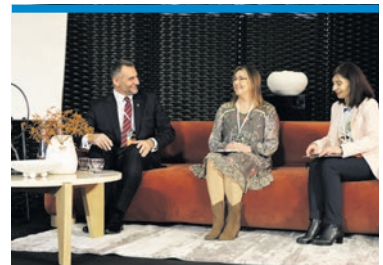
Bieruń dobrze projektowany.