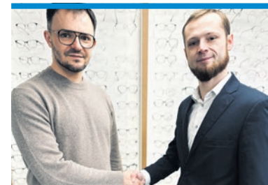
Łędziny Od Nowa stawiają na przedsiębiorczość.