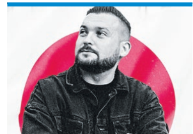
Inspektor dołowy z Kopalni Ziemowit gwiazdą w Japonii!